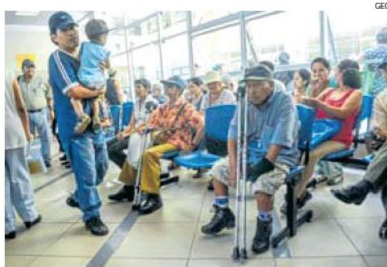
Protección. El 70% de la población peruana tiene la cobertura del Sistema Integral de Salud.

Velasco también resaltó que existe asimetría de la información en el mercado de salud. “Entonces, la inequidad y la