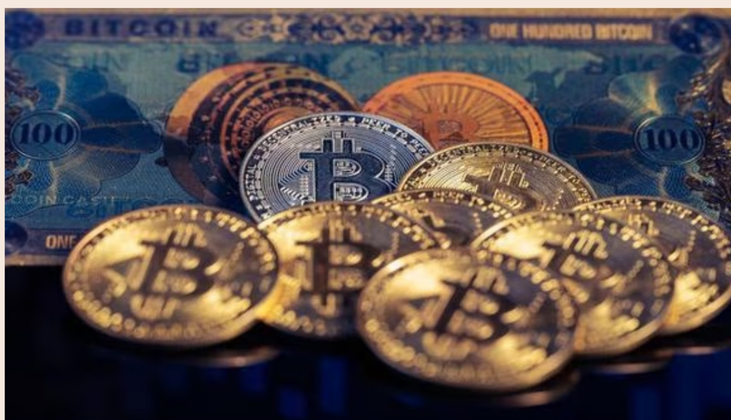
Los préstamos en criptomonedas tienen un riesgo implícito que radica en la volatilidad del valor de mercado de estos activos digitales.

Es legalmente viable y posible tomar préstamos en criptomonedas de acuerdo con la legislación vigente. Las criptomonedas son bienes muebles intangibles y, como tales, susceptibles de contratos de mutuo regulados por el Código Civil peruano.