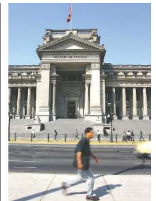
Sala Penal Especializada.

TAMBIÉN PODRÁN VISITAR el portal www.sunat.gob.pe , en el que encontrarán orientación y asistencia sin necesidad de salir de casa, añadió la entidad recaudadora.