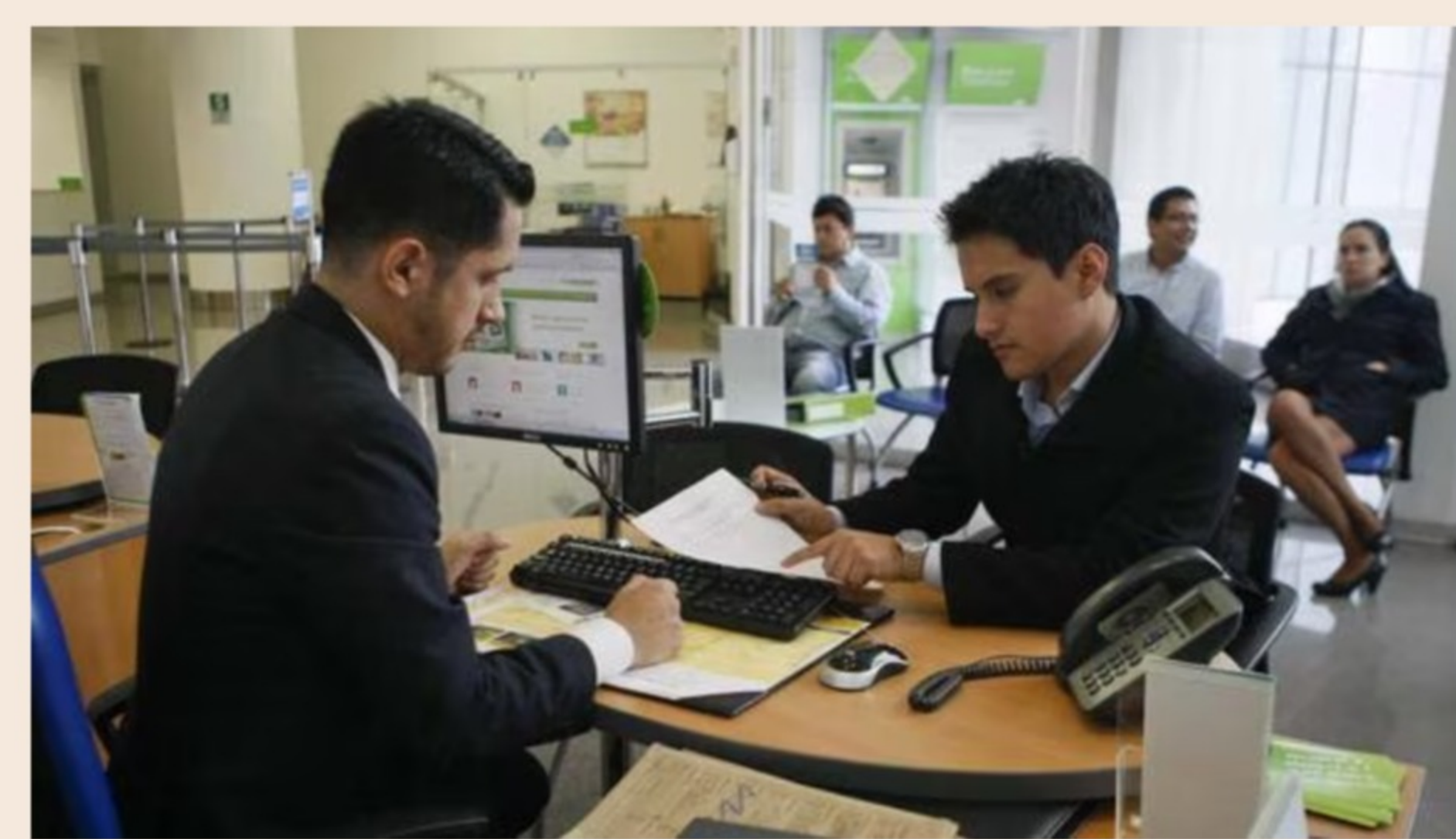
La reprogramación de deuda se puede acordar antes de que se incumpla con el pago de una cuota.

Son tres las alternativas a las que una empresa puede acordar con una entidad crediticia: reprogramar, refinanciar o reestructurar su deuda.