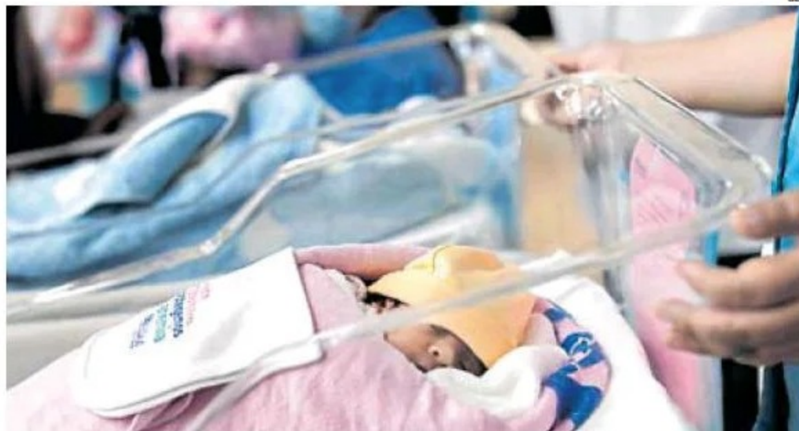
Persona. Estado le depositaría fondos en una cuenta individual de capitalización, según la propuesta.

Al ser la mayoría de representantes del Ejecutivo en la propuesta final tendría que prevalecer la posición del Gobierno, precisó el presidente de la