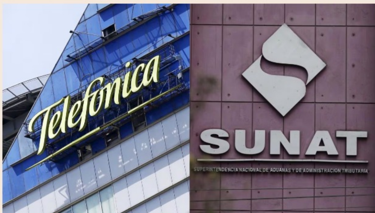
Sunat podría devolver cartas fianzas a Telefónica, ¿qué procede?

> Telefónica: PJ revierte decisión de ejecución de cartas fianzas por más de S/ 371 millones