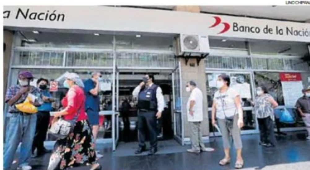
Banco de la Nación. En 90 días se modificará su estatuto para adecuarlo a la norma.

Bajo tales lineamientos, el directorio del BN podrá apro-