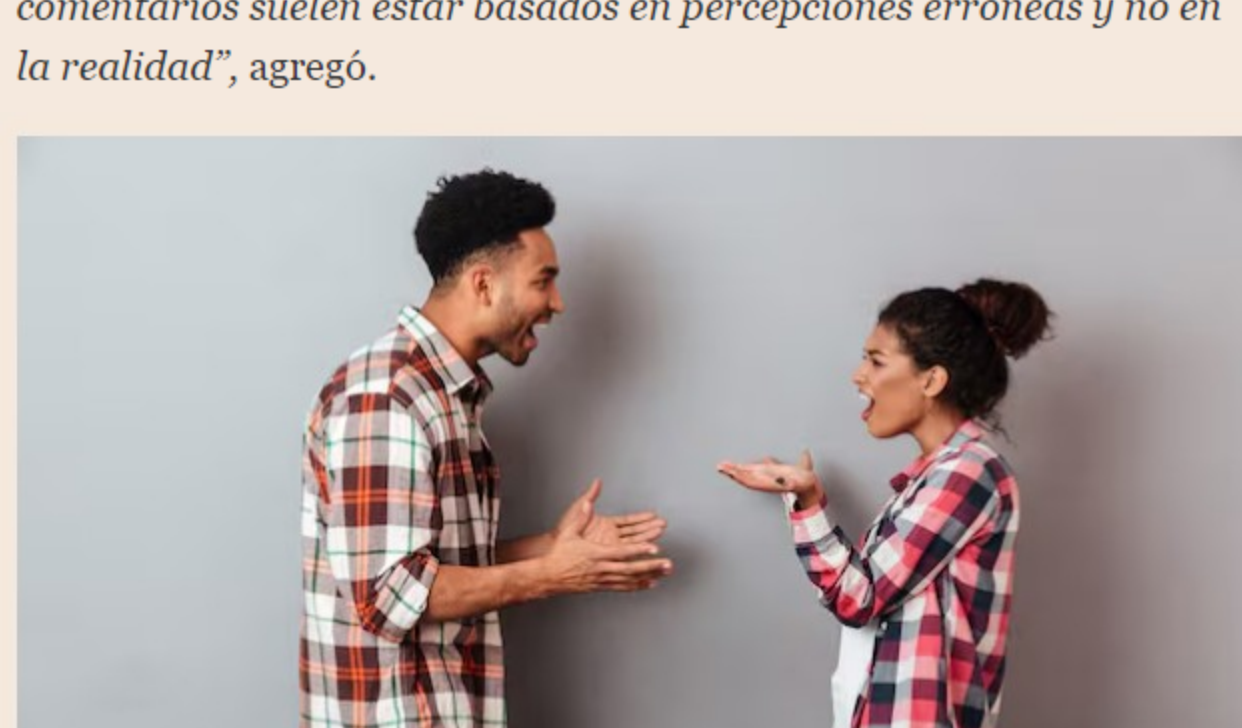
Sanciones por generar comentarios malintencionados en el trabajo.

“Para mantener la tranquilidad emocional es importante centrarse en el trabajo y mantener un enfoque positivo. Comunicarse abiertamente con las personas cercanas y fomentar un entorno de apoyo puede ayudar. También es útil recordar que este tipo de comentarios suelen estar basados en percepciones erróneas y no en la realidad”, agregó.