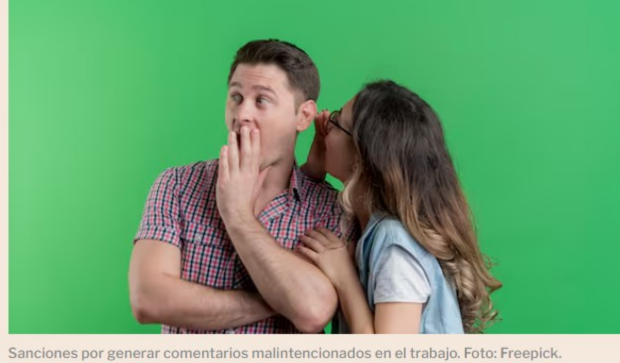
Sanciones por generar comentarios malintencionados en el trabajo.

> Cinco razones por las que la gente es despedida