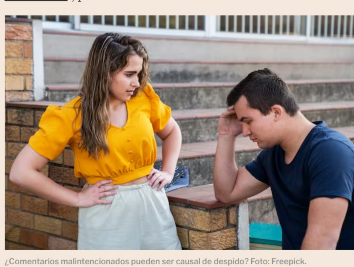
¿Comentarios malintencionados pueden ser causal de despido?

“Detrás de una conducta identificada como inapropiada, como generar comentarios suspicaces o difundir información imprecisa, se encuentra una clara ruptura de la armonía laboral. Hay que tener en cuenta que la legislación permite sancionar con el despido cuando un hecho es de alta gravedad y relevancia ”, precisó.