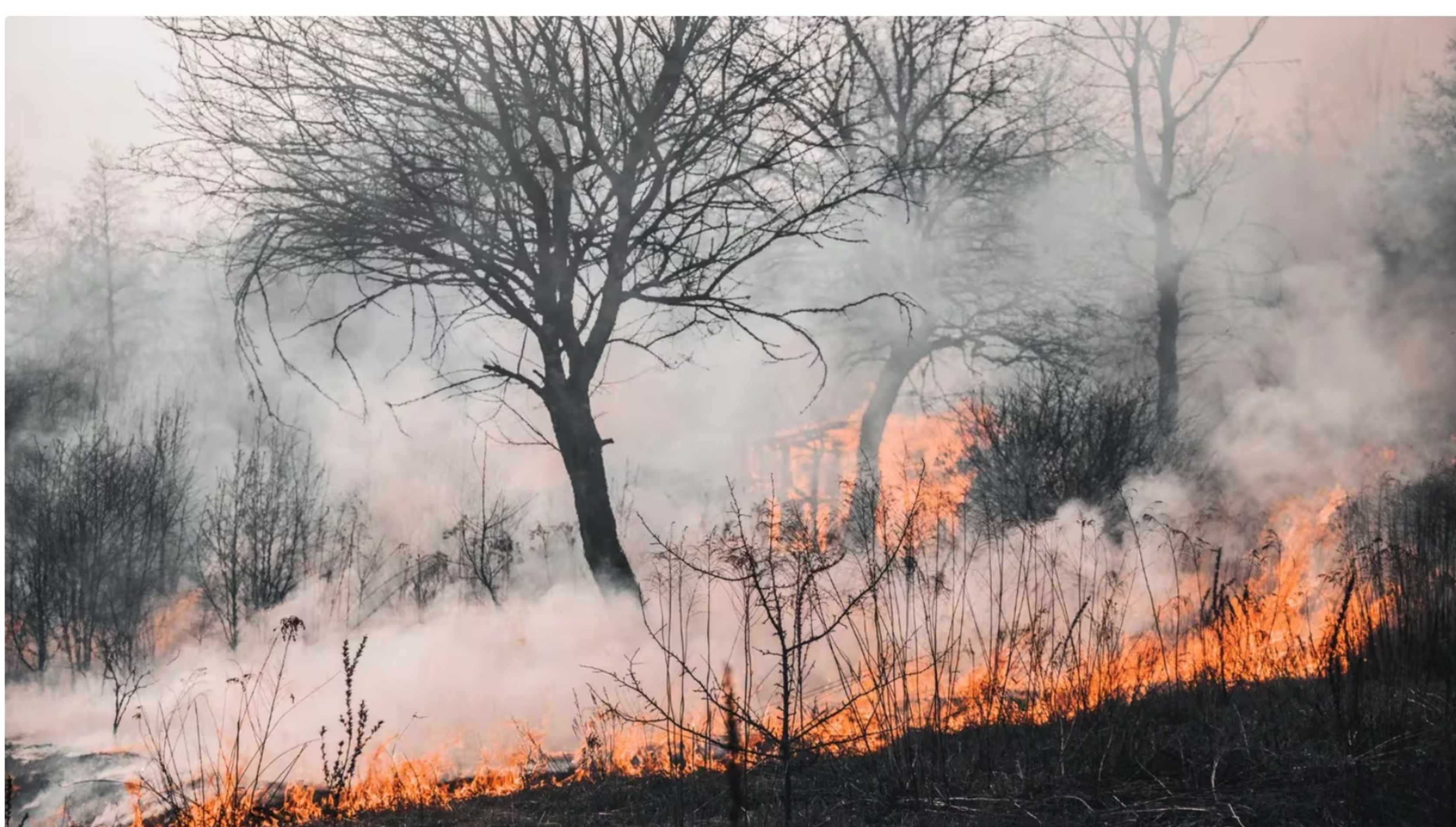
Más de 7.000 hectáreas han sido destruidas por incendios forestales

El Perú enfrenta una oleada de incendios forestales que vienen afectando varias regiones del país, principalmente en los departamentos de Amazonas, Ucayali, Loreto y Cusco . Estos incendios, avivados por condiciones climáticas desfavorables, la deforestación y prácticas agrícolas inapropiadas, generan graves consecuencias tanto para el medio ambiente como para los principales sectores económicos del país.