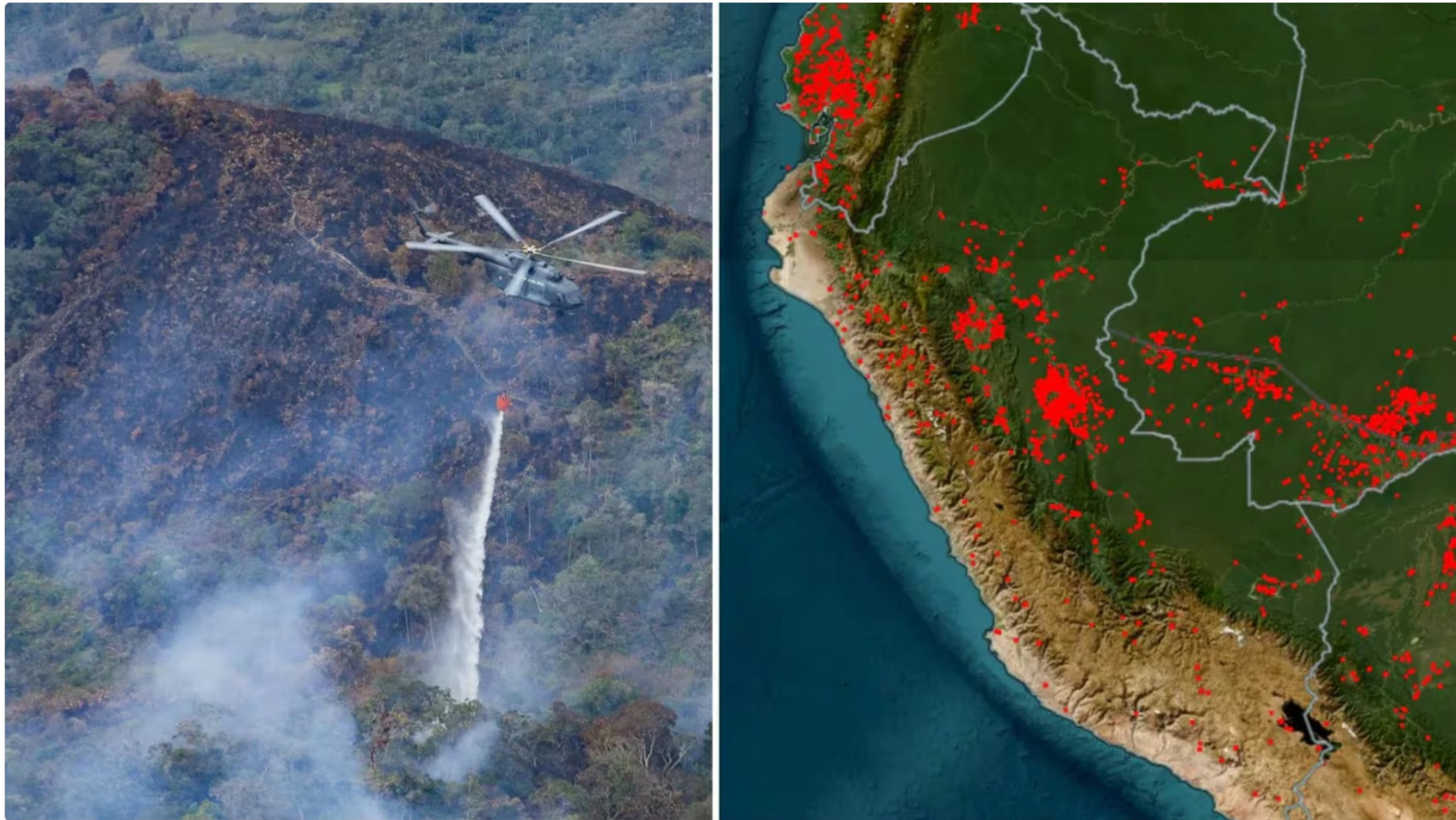
Incendios forestales - Andina

Te puede interesar: Gisela Valcárcel se pronuncia en medio de la polémica por su amistad con Andrés Hurtado