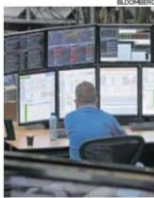
Mercado. Expectativa por impacto de eventuales nuevos retiros.

“La normativa regula cómo se va a llevar a cabo la venta de los excesos de inversión, sobre todo en instrumentos ilíquidos como los alternativos. Con los