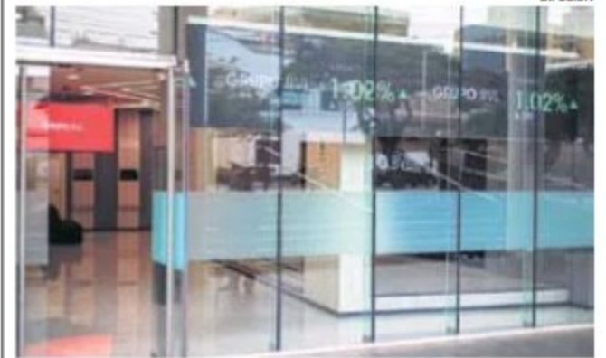
BVL. Se alinea al comportamiento de índices bursátiles mundiales.