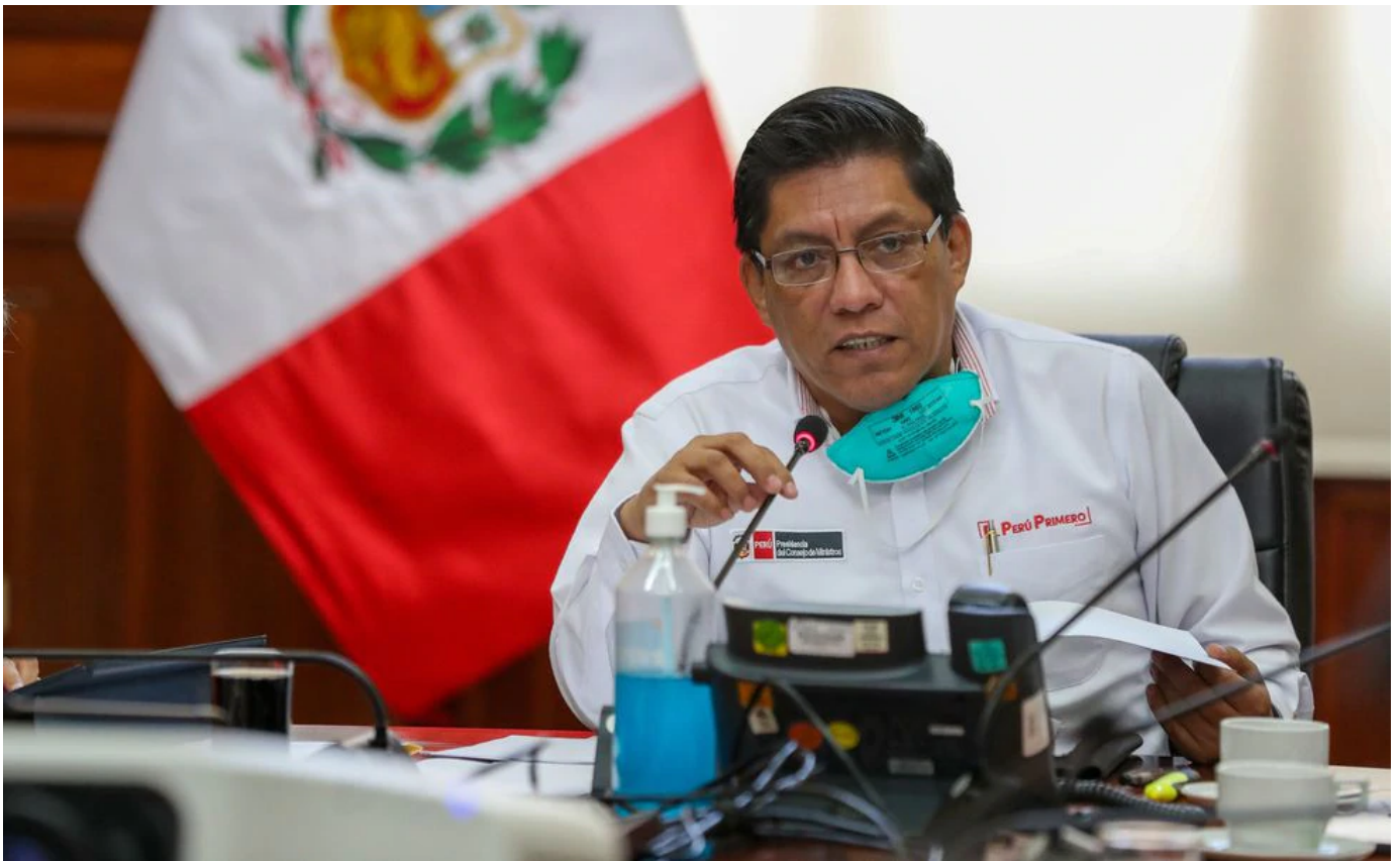
Primer ministro Vicente Zaballos.